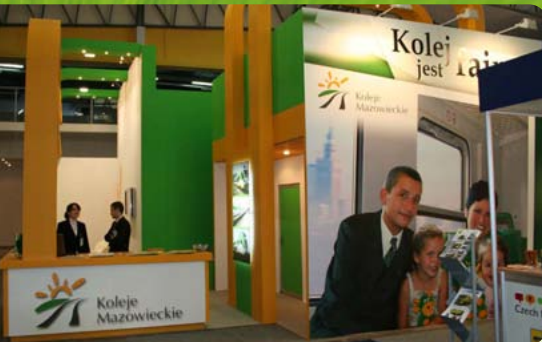
Fot.: Stoisko promocyjne Kolei Mazowieckich na Międzynarodowych Targach Kolejowych TRAKO